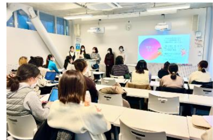
2023年の『社会連携を学ぶ』授業の様子

明治の広報部メンバーが外部ゲストとして参加した2021年度、2022年度のJWU社会連携科目「社会連携を学ぶB」での授業において、社会課題の解決を目指す新たな食育活動として「大学生にとっての食を通じたケア」を明治に提案したことがチーム発足のきっかけとなりました。