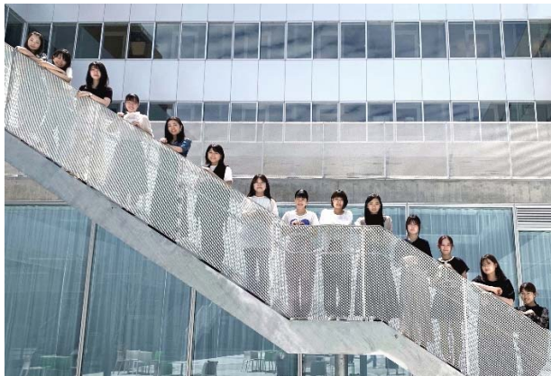
JWU PR アンバサダー リーダー